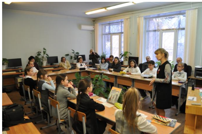
Classe de français au gymnase n°5

Réfléchissons à ce que notre association pourrait proposer dans ce cadre : exposition sur la ville de Volgograd, échanges entre lycéens étudiant la langue de l'autre, regard de jeunes ou moins jeunes sur leur ville à transmettre à nos partenaires, ... Nos cours et ateliers de russe pourraient aussi s'intégrer à ces initiatives et réfléchir à des échanges virtuels. Les possibilités d'actions sont multiples ; à nous d'y réfléchir et de les concrétiser. Pour une fois que la Russie est à l'honneur, profitons en.